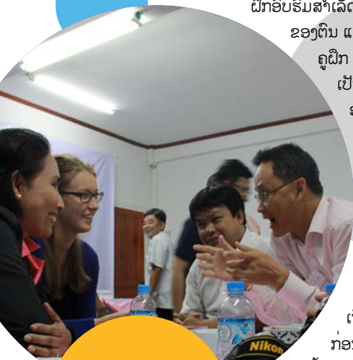
ການເຂົ້າຮ່ວມຝຶກ ອົບຮົມ ການນຳໃຊ້ Soft Skills ໃນວຽກງານການສຶກສາ ນອກໂຮງຮຽນ

ເພື່ອພັດທະນາທັກສະການສອນ ໃນດ້ານການສຶກສານອກໂຮງຮຽນ ອົງການດິວິວີ ອິນເຕີເນເຊັນແນວ ໄດ້ໃຊ້ຫຼັກການກ້ອນຫີມະ(ຄູແມ່ໄກ່). ໃນໄລຍະ 2 ປີ ຄູຝຶກ 25 ທ່ານ(ທີ່ ຜູ້ທີ່ເຮັດວຽກໃນດ້ານການ ສຶກສາຜູ້ໃຫຍ່) ຈາກທັງໝົດ ໃນທົ່ວປະເທດ ລາວແມ່ນການໄດ້ຮັບການຝຶກອົບຮົມ ແລະ ຮູ້ເຖິງວິທີການ