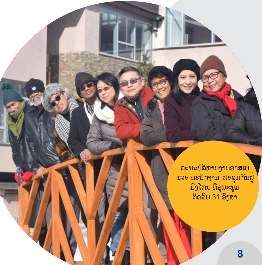
ຄະນະບໍລິຫານງານອາສເບ ແລະ ພະນັກງານ ປະຊຸມກັນຢູ່ ມົງໂກນ ທີ່ອຸນະພູມ ຕິດລົບ 31 ອົງສາ

ຄະນະຜູ້ບໍລິຫານ ແລະ ພະນັກງານຂອງອາສເບ ຍັງໄດ້ສຳຜັດກັບວັດທະ ນະທຳຂອງປະເທດມົງໂກນ ເຊິ່ງລວມເຖິງການຍ້ຽມຊົມທີ່ພິພິຕະພັນ ແຫ່ງຊາດ, ງານລ້ຽງສະຫຼອງຕ້ອນຮັບດ້ວຍດິນຕຣີພິ້ນເມືອງ ແລະ ການຟອນລຳພິ້ນເມືອງ, ອາຫານມົງໂກນ ແລະ ສຸດທ້າຍແຕ່ບໍ່ທ້າຍສຸດ, ໃນຊ່ວງລະດູໜາວຂອງມົງໂກນຂອງອຸນຫະພູມຕຳສຸດຢູ່ທີ່ -31 ອົງສາ! ກອງປະຊຸມຄະນະບໍລິຫານຕໍ່ໄປຍິນດີຕ້ອນຮັບສະມາຊິກໃໝ່ ຂອງ ຄະນະບໍລິຫານ, ລວມທັງປະທານໃໝ່ ແລະ ຜູ້ແທນໃໝ່ ຈາກອາຊີໃຕ້ ແລະ ອາຊີກາງ, ອາຊີຕາເວັນອອກສຽງໃຕ້, ອາຊີຕາເວັນອອກ, ແລະ ອາຊີປາຊີຟິກໃຕ້.