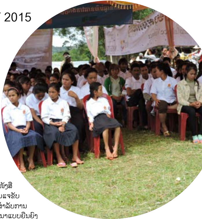
ການຮູ້ໜັງສື ເປັນກຸ່ມແຈ້ງ ເຄື່ອນສຳລັບການ ພັດທະນາແບບຍືນຍົງ

ວັນທີ 8 ເດືອນກັນຍາ, ປີ 2015, ເປັນເຄື່ອງໝາຍສະແດງສະເຫຼີມສະຫຼອງ ວັນສາກົນແຫ່ງການລົບລ້າງຄວາມບໍ່ຮູ້ໜັງສື. ການສະເຫຼີມສະຫຼອງ ຈະຊ່ວຍໃຫ້ ຊຸມຊົນທົ່ວໂລກພ້ອມໃຈກັນສົ່ງສຽງສ້າງຄວາມຕື່ນເຕັ້ນເພື່ອຄົນ ທີ່ບໍ່ສາມາດອ່ານ ແລະ ຂຽນ. ວັນລົບລ້າງຄວາມບໍ່ຮູ້ໜັງສືເຮັດໃຫ້ເດັກນ້ອຍ ແລະ ຊຸມຊົນມີໂອກາດທີ່ຈະຄົ້ນພົບຄວາມສຸກຂອງການອ່ານ ໃນຂະນະ ດຽວກັນກໍເປັນການປູກຈິດສຳນຶກສຳລັບຜູ້ທີ່ບໍ່ສາມາດເຂົ້າເຖິງການສຶກສາ. ໃນປີນີ້ຫົວຂໍ້ຂອງວັນສາກົນແຫ່ງການລົບລ້າງຄວາມບໍ່ຮູ້ໜັງສື ແມ່ນ “ການຮູ້ໜັງສື ແລະ ສັງຄົມທີ່ຍືນຍົງ” ແລະ ຫົວຂໍ້ຂອງ ກຳປູເຈຍສຳລັບ ການສະຫຼອງວັນສາກົນແຫ່ງການລົບລ້າງຄວາມບໍ່ຮູ້ໜັງສື ແມ່ນ “ການຮູ້ໜັງສືປະກອບສ່ວນໃນການຫຼຸດປັດໄຈສູງທາງການຍ້າຍຖິ່ນຖານ”.