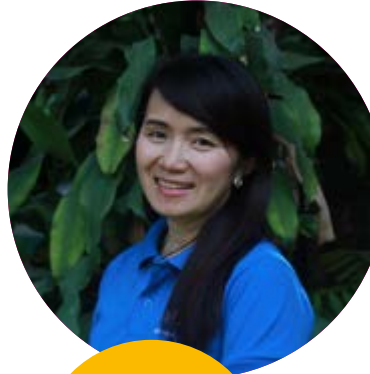
ຜູ້ບໍລິຫານໂຄງການສ້າງຂັດຄວາມອາດສາມາດ ແລະ ການຕິດຕາມປະເມີນຜົນ

ໃນຕອນທ້າຍຂອງການຝຶກອົບຮົມ, ຜູ້ເຂົ້າຮ່ວມຄາດວ່າຈະບໍ່ພຽງແຕ່ເອົາໃຈໃສ່ກັບທັກສະຂອງໂມດູນເຫຼົ່ານັ້ນເທົ່ານັ້ນແຕ່ຍັງຕ້ອງມີຄວາມຫ້າວຫັນໃນການກຳນົດບັນຫາ ແລະ ດຳເນີນການທີ່ຈຳເປັນກັບພາກສ່ວນກ່ຽວຂ້ອງອື່ນໆ.