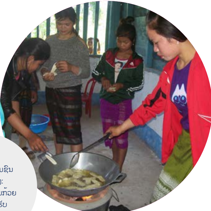
ສູນການຮຽນຮູ້ຊຸມຊົນ ໃນເມືອງນອງ: ຝຶກອົບຮົມການຈົນກ້ວຍ ເພື່ອສ້າງລາຍຮັບ

ຫວຽດນາມ: ແນວຄວາມຄິດສັງຄົມການຮຽນຮູ້ຕະຫຼອດຊີວິດແມ່ນໄດ້ຖືກປູກຝັງຢູ່ແລວ ແລະ ມີສູນການຮຽນຮູ້ຊຸມຊົນຈຳນວນຫຼາຍໃນລະດັບບານ ໄທ: ສຳນັກງານສົ່ງເສີມການສຶກສານອກລະບົບ ແລະ ການສຶກສາຕາມອັດທະຍາໃສ (ONIE) ມີສູນການຮຽນຮູ້ຊຸມຊົນຈຳນວນຫຼາຍພ້ອມທັງການເຊື່ອມຕໍ່ອິນເຕີເນັດ