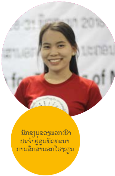
ນັກຮຽນຂອງພວກເຮົາປະຈຳຢູ່ສູນພັດທະນາການສຶກສານອກໂຮງຮຽນ

ໂອກາດ: ຄູ, ນັກຮຽນ ແລະ ນັກການສຶກສາຜູ້ໃຫຍ່ໄດ້ພັດທະນາຄວາມສາມາດ ແລະ ຄວາມຮູ້ກ່ຽວກັບເຕັກໂນໂລຊີອອນໄລ ມີເວລາໃຫ້ໂຕເອງ ແລະ ຄອບຄົວຫຼາຍຂຶ້ນ ແລະ ໄດ້ຮຽນຮູ້ເພີ່ມເຕີມກຽວກັບການເບິ່ງແຍງຮັກສາສຸຂະພາບຂອງຕົນເອງ.