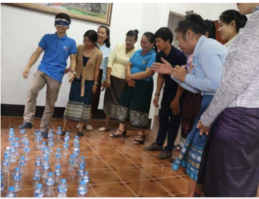
ກິດຈະກຳໃນລະຫວ່າງການຝຶກອົບຮົມ ເພື່ອກະກຽມການຝຶກອົບຮົມອອນໄລທີ່ ສພນ