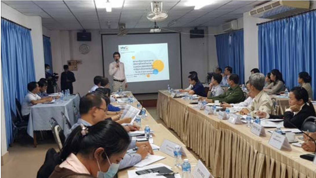
ກອງປະຊຸມເຜີຍແຜ່ ບົດຄົ້ນຄວ້າວິໄຈ ທີ່ຄະນະສຶກສາສາດ, ມະຫາວິທະຍາໄລແຫ່ງຊາດລາວ

Education for Everyone. Worldwide. Lifelong.