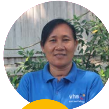
ຜູ້ບໍລິຫານໂຄງການ ດ້ານການຮຽນຮູ້ທັງສີ ແລະ ການສຶກສານອກໂຮງຮຽນ

ພວກເຮົາກໍ່ໄດ້ຊອກຫາວິທີທາງ ໃນການສະໜັບສະໜູນຊ່ວຍເຫຼືອເຂົາເຈົ້າ ເພື່ອຊອກຫາຄູ່ຝຶກທີ່ມີປະສິດທິ ແລະ ໄດ້ຄຸນນະພາບ ທີ່ກ່ຽວພັນກັບຫົວຂໍ້ ວິຊາຕ່າງໆ ທີ່ທາງບ້ານກໍ່ຄືກຸ່ມທີ່ຕ້ອງການຮຽນຮູ້, ເຊິ່ງຄູ່ຝຶກດັ່ງກ່າວແມ່ນໄດ້ມາຈາກ