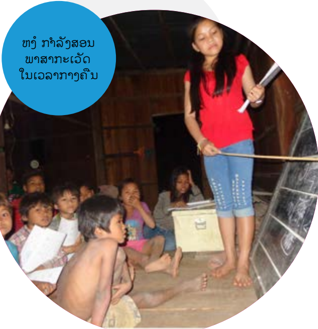
ຫງໍ ກຳລັງສອນ ພາສາກາເວັດ ໃນເວລາກາງຄືນ

ຂ້ອຍ ປາຖະໜາຢາກເຫັນ ຫ້ອງການ ດີວີວີ ອິນເຕີເນເຊັນແນວ ແລະ ອົງການ NTFP ສືບຕໍ່ສະໜັບສະໜູນຊຸມຊົນຂອງຂ້ອຍ.