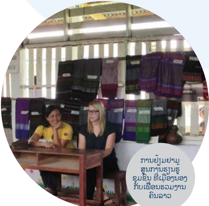
ການຍັງມຢາມສູນການຮຽນຮູ້ຊຸມຊົນ ທີ່ເມືອງນອງ ກັບເພື່ອນຮ່ວມງານຄົນລາວ

ຂອບໃຈປະເທດລາວ ໂດຍສະເພາະ ຂໍຂອບໃຈເປັນຢ່າງສູງມາຍັງ ທີມງານຫ້ອງການ ດີວີວີ ອິນເຕີເນເຊັນແນວ ທີ່ເຮັດໃຫ້ຂ້ອຍໄດ້ມີປະສົບການທີ່ຍິ່ງໃຫຍ່ ໃນການດຳລົງຊີວິດຢູ່ປະເທດລາວ! ຂອບໃຈຫຼາຍໆ!