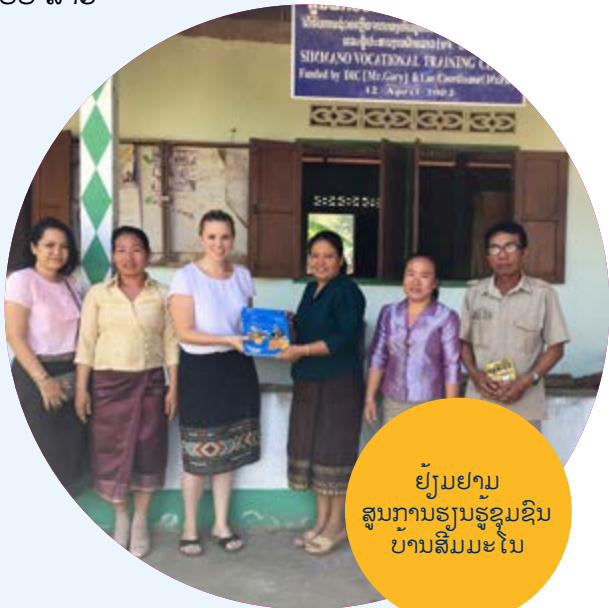
ຍັງມຢາມສູນການຮຽນຮູ້ຊຸມຊົນບ້ານສົມມະໂນ

ການເຮັດວຽກໃນແຕ່ລະມື້ຂອງຂ້ອຍ ການເຂົ້າຮ່ວມປະຊຸມກັບພາກສ່ວນຕ່າງໆ ແລະ ຄູ່ຮ່ວມພັດທະນາ ເຊັ່ນດຽວກັບການເຮັດວຽກແລກປ່ຽນກັນກັບ