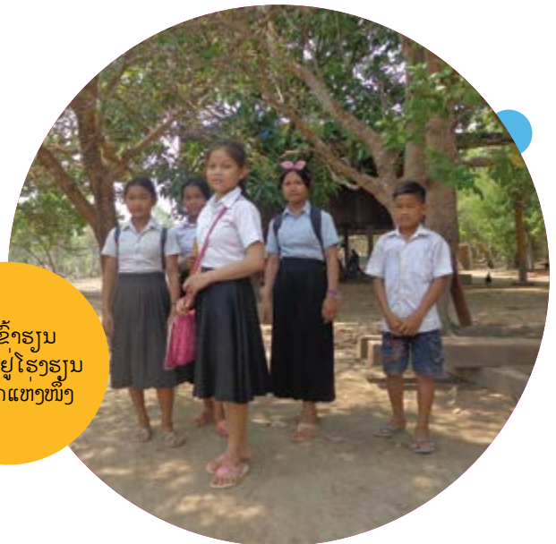
ຫງໍ ເຂົ້າຮຽນ ຊັ້ນ ບໍ່ 6 ຢູ່ໂຮງຮຽນ ຂອງລັດແຫ່ງໜຶ່ງ

ຕັ້ງແຕ່ປີ 2013 ໂຄງການ ການສຶກສານອກໂຮງຮຽນຂອງ ອົງການ NTFP ໄດ້ສະໜັບສະໜູນຫ້ອງຮຽນພາສາຂະເໝນ ແລະ ພາສາກາເວັດ ໃນພູບ້ານ ຂອງຂ້ອຍ ແລະ ຂ້ອຍໄດ້ໄປຮຽນໃນຕອນກາງຄືນ