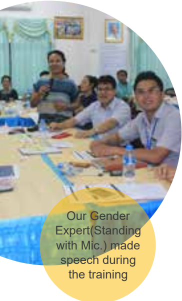
Our Gender Expert (Standing with Mic.) made speech during the training

ການລິເລີ່ມຂອງ ດິວິດີ ອິນເຕີເນເຊັນແນວ ຫ້ອງການປະຈຳ ພາກພື້ນຢູ່ທີ່ວຽງຈັນໄດ້ບັນຈຸເອົາໂມດູນ ບົດບາດຍິງ-ຊາຍ ເຂົ້າໃນການຝຶກອົບຮົມຄູ່ຝຶກ ແລະ ໄດ້ເລີ່ມການເຈລະຈາ ນຳກັນວ່າ ຜູ້ເຂົ້າຮ່ວມຮ່ວມຝຶກອົບຮົມຄູ່ຝຶກນີ້ຕ້ອງມີຈຳນວນ ເທົ່າກັນ, ນີ້ສະແດງເຖິງການໃຫ້ຄຳພັນສັນຍາໃນການເຊື່ອມ ສານບົດບາດຍິງ-ຊາຍ ແລະ ໂດຍອີງໃສ່ຄວາມເອົາໃຈໃສ່ກ່ຽວ ກັບບົດບາດຍິງ-ຊາຍໃນແຜນງານຂອງເຂົາເຈົ້າ. ■