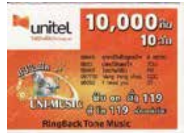
ບໍລິການສຽງເພງລໍສາຍ