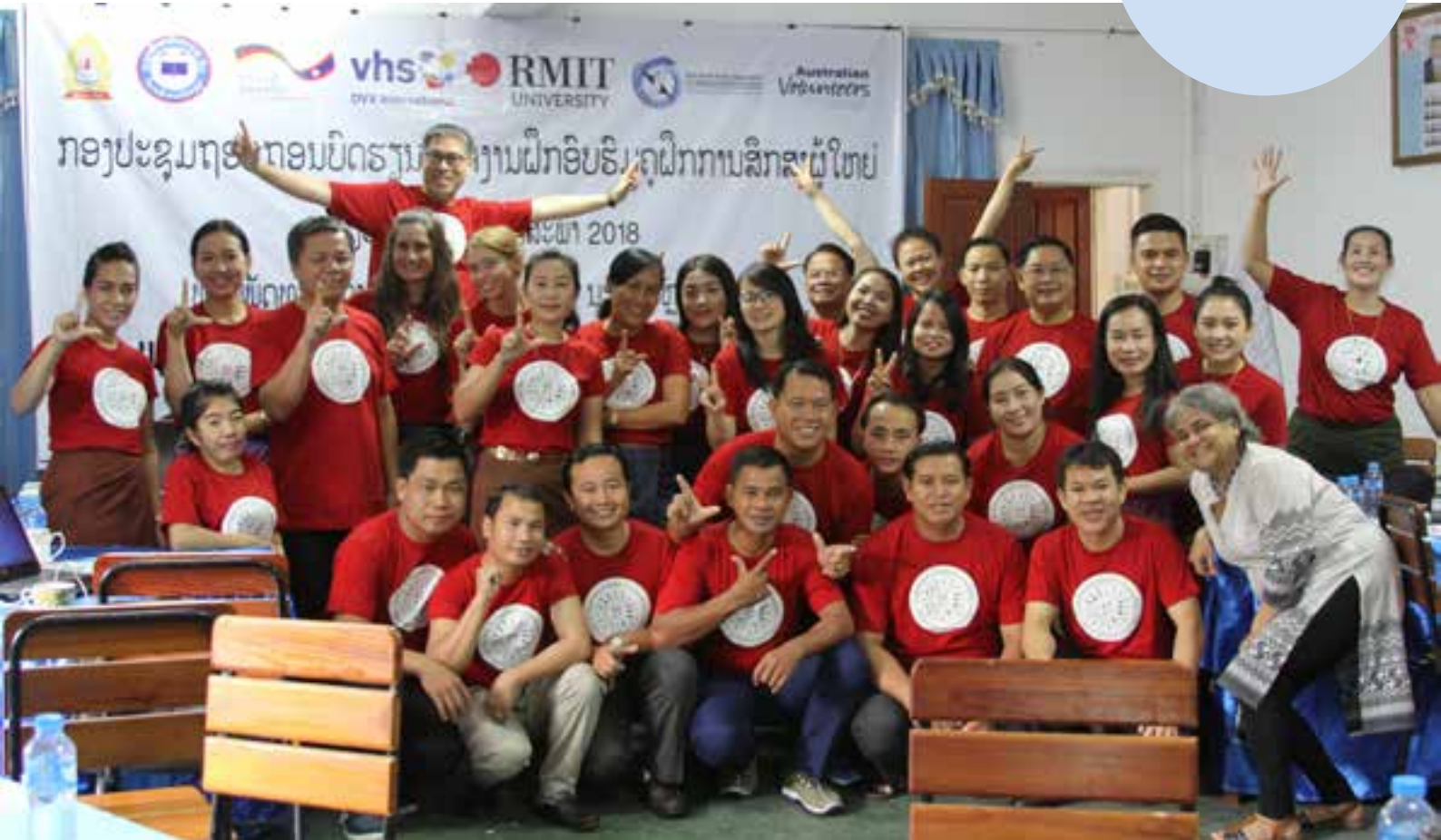
ສະມາຊິກຂອງ ຄູຝຶກຫຼັກ ແລະ ບັນດາຊ່ຽວຊານ