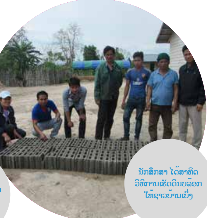
ນັກສຶກສາ ໄດ້ສາທິດວິທີການເຮັດດິນບລັອກໃຫ້ຊາວບ້ານເບິ່ງ