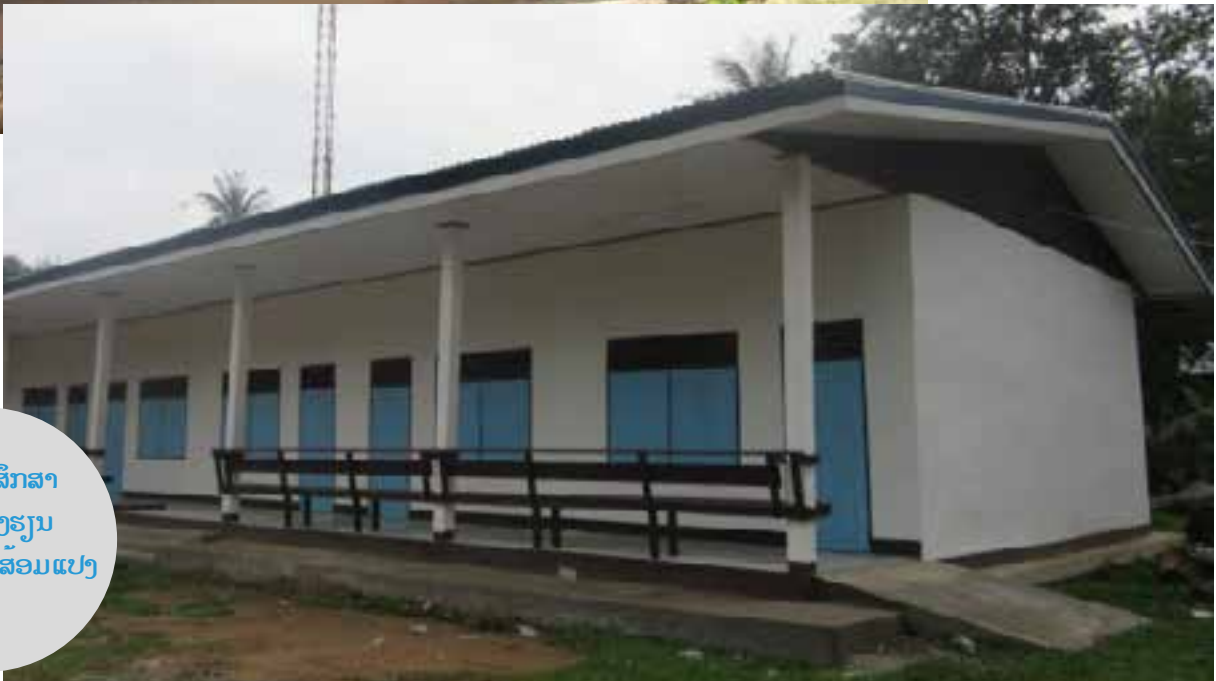
ສູນການສຶກສາ ນອກໂຮງຮຽນ ພາຍຫຼັງການສ້ອມແປງ