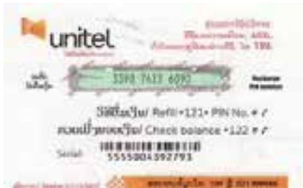
ບັດຕື່ມເງິນ ແລະ ວິທີການຕື່ມເງິນ

ຮູບທີ 1: ຕົວຢ່າງຂອງການປຶກາໂທລະສັບ ແລະ ວິທີການໃຊ້