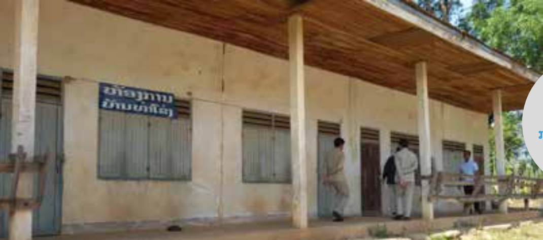
ອາຄານສູນ ກ່ອນການສ້ອມແປງ

ເພື່ອພັດທະນາສູນການສຶກສານອກໂຮງຮຽນເມືອງເຊໂປນໃຫ້ມີ ຄຸນນະພາບ ແລະກາຍເປັນສູນແຫ່ງການຮຽນຮູ້ນັ້ນ ໃນຕໍ່ໜ້າຈະໄດ້ ສຸມໃສ່ບາງວຽກງານທີ່ເປັນບູລິມະສິດເຊັ່ນ: ວຽກງານບຳລຸງຍົກລະດັບ ການສຶກສາຕໍ່ເນື່ອງເພື່ອສົ່ງເສີມການຮຽນຮູ້ຕະຫຼອດຊີວິດ, ວຽກງານຝຶກ ອົບຮົມວິຊາຊີບຂັ້ນພື້ນຖານ, ການສ້າງລາຍໄດ້ຂອງສູນ ແລະກຸ່ມ ເປົ້າໝາຍ; ການສົ່ງເສີມຊຸມຊົນ, ຊາວໜຸ່ມ, ແມ່ຍິງ ແລະເດັກນ້ອຍ ພ້ອມ ທັງຍາດແຍ່ງເອົາການສະໜັບສະໜູນຮ່ວມມືກັບທຸກພາກສ່ວນທັງ ພາກລັດ, ເອກະຊົນ, ອົງການຈັດຕັ້ງສາກົນ, ອົງການຈັດຕັ້ງທາງສັມຄົມ ແລະຊຸມຊົນ.