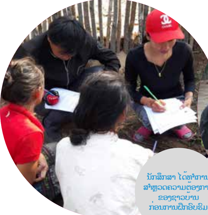
ນັກສຶກສາ ໄດ້ທຳການສຳຫຼວດຄວາມຕ້ອງການຂອງຊາວບ້ານກ່ອນການຝຶກອົບຮົມ

ຂະບວນການຝຶກທັດຂອງນັກສຶກສາໄດ້ປະສົບຜົນສຳເລັດໄປດ້ວຍດີ ແລະ ຕາມການຄາດໝາຍ ການຝຶກງານຄັ້ງນີ້ເປັນບົດຮຽນອັນລ້ຳຄ່າສຳລັບຫ້ອງການ ດິວິວີ ອິນເຕີເນເຊັນແນວ ແລະ ນັກສຶກສາ. ເປັນຄັ້ງທຳອິດທີ່ ໄດ້ນຳສິ່ງນັກສຶກສາໄປຝຶກງານຢູ່ບ້ານເປົ້າໝາຍຂອງໂຄງການ.