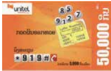
ວິທີການກວດຜົນຫວຍ